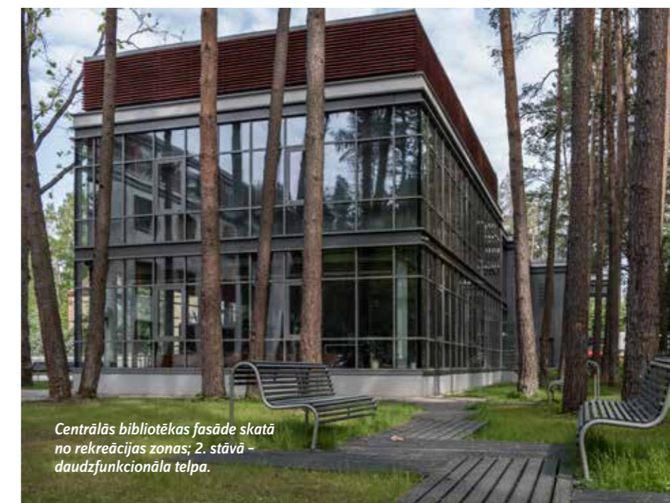
Centrālās bibliotēkas fasāde skatā no rekreācijas zonas; 2. stāvā - daudzfunkcionāla telpa.

Absolvējis RTU APF (2012), arhitekts. Darba pieredze: «Sestais Stils» (2006-2009), «Skonto Būve» (2009-2016), «DUAL arhitekti» dibinātājs, valdes priekšsēdētājs, arhitekts (kopš 2016). Galvenie realizētie objekti: Dubultu kultūras kvartāls (2018), Tukuma 3. pamatskolas sporta zāle un stadions (2018), Jaunolaines sākumskolas sporta zāle (2017).