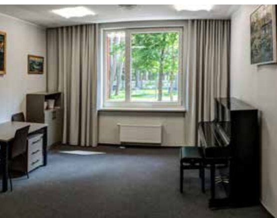
Mūzikas vidusskolas rekreācijas vestibils 2. stāvā, koka apdare sienām un griestiem, āra žalūzijas nodrošina telpu nepārkaršanu.