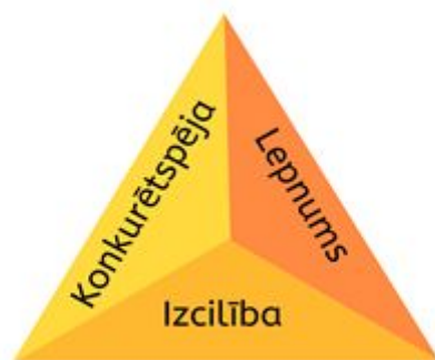
1.attēls Skolas attīstības vīzijas trīs pīlāri

Tā nosaka virzienu un mērķus klūt par skolu, kas nodrošina augsti konkurētspējīgu profesionālās ievirzes izglītības piedāvājumu un sniedz nozīmīgu pienesumu Latvijas, Baltijas